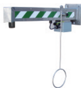
BR 819 795

Подключение к сети водоснабжения: наружная резьба 3/8" Водослив: 1 1/4" Подключение к электросети: 230 В – 50 Гц Габаритные размеры (В x Ш x Г): 285 x 355 x 305 мм