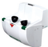
BR 826 095