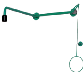
BR 084 085

BR 082 075: латунь, порошковое напыление красного цвета BR 082 095: высококачественная сталь, полированная