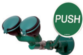
BR 250 085

Подключение к сети водоснабжения: наружная резьба 1/2" Общая ширина, включая рукоятку: 240 мм Высота: 180 мм