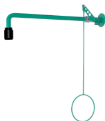
BR 082 085

BR 081 075: латунь, порошковое напыление красного цвета BR 081 095: высококачественная сталь, полированная