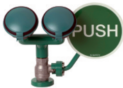
BR 200 085